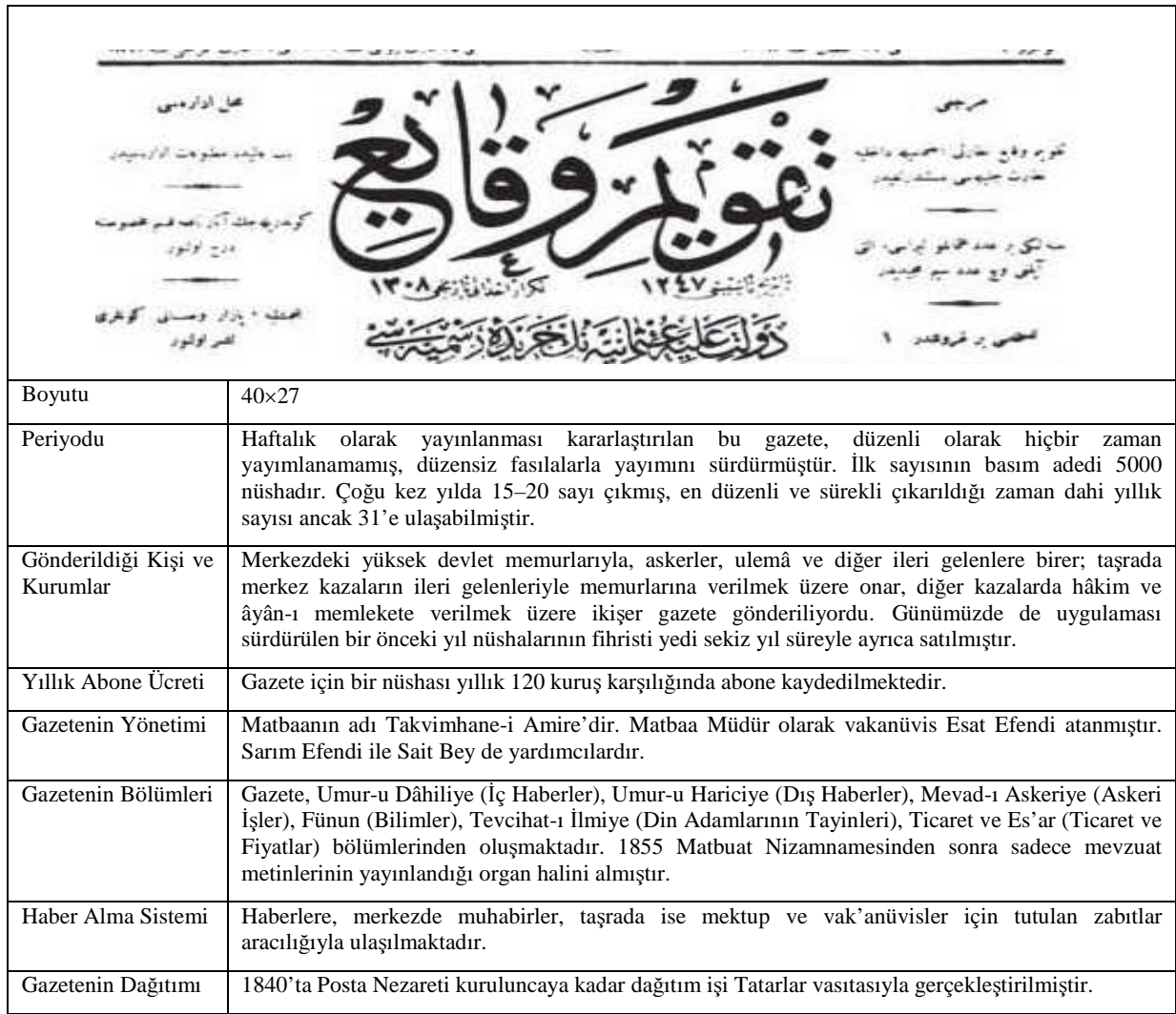
Çizelge 2: Takvim-i Vekayi'nin Biçimsel Özellikleri 17