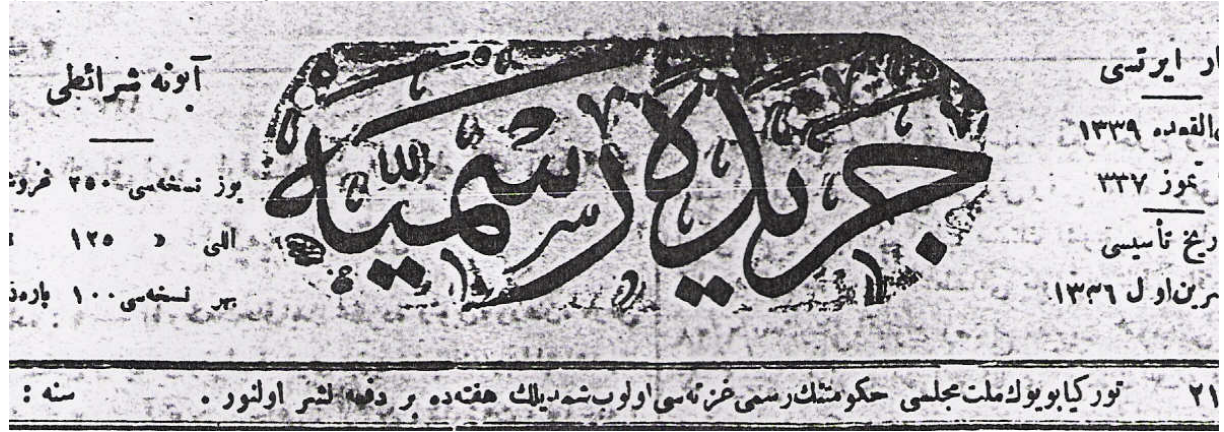
Şekil 1 Ceride-i Resmîye 21

Türkiye Cumhuriyeti Resmi Gazetesi yayım hayatına başladığı 1920 yılından itibaren üç farklı ad altında yayımlanmıştır. Gazete, 1920-1923 yılları arasında Ceride-i Resmîye, 1923-1927 yılları arasında Resmi Ceride, 1927 yılından itibaren de Türkiye Cumhuriyeti Resmi Gazetesi adını almıştır.